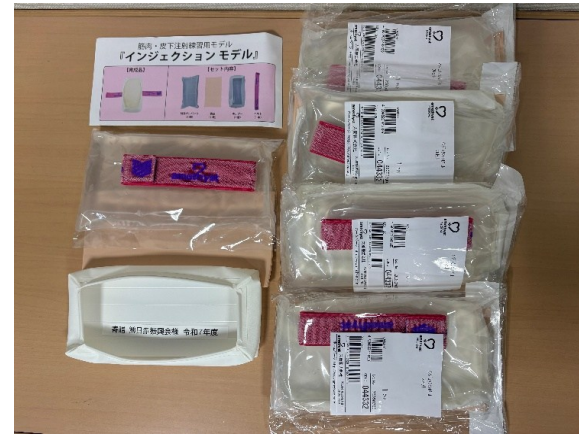
インジェクションモデル