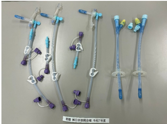
GB胃瘻バルーンカテーテル