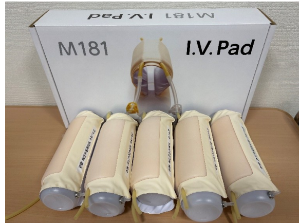
装着型静脈注射トレーナー